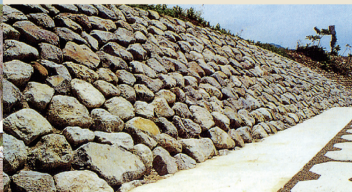
人口大玉自然石「ネオストーン」