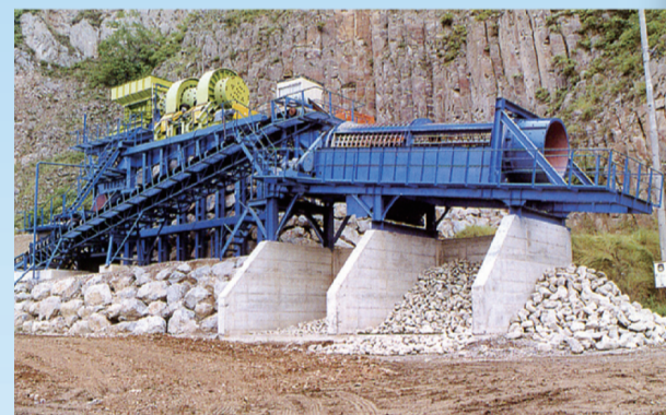
最新式人工大玉自然石製造プラント「ガロ」